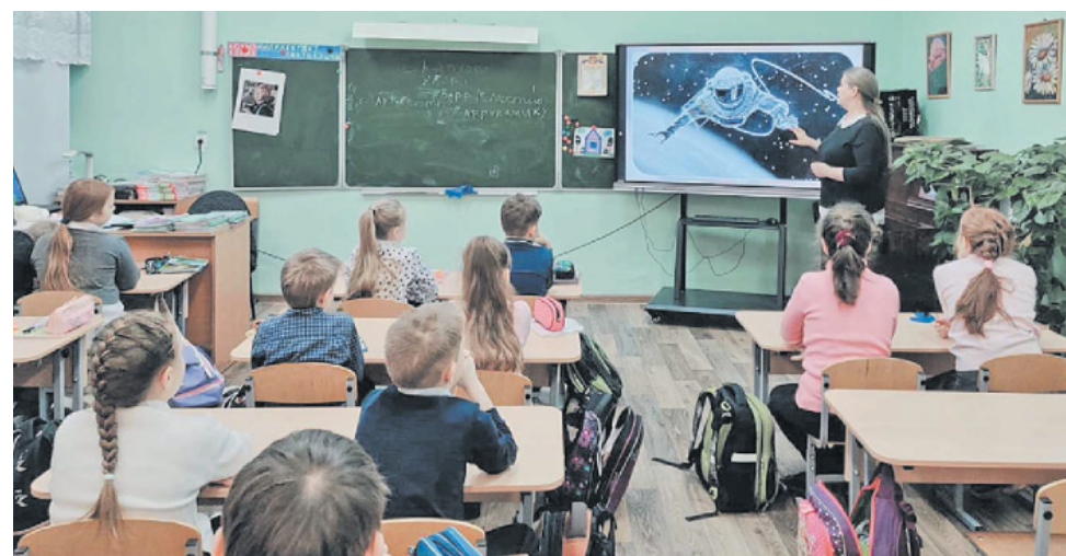
Урок окружающего мира в Карачихской школе

Источник успеха – труд команды единомышленников, профессионалов, занимающихся нужным и важным делом – воспитанием подрастающего поколения.