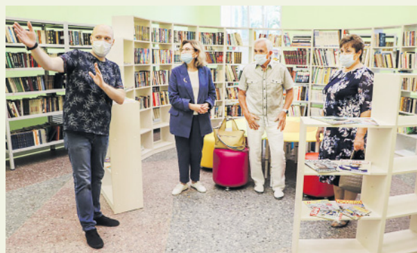
В обновленной библиотеке с. Сарафоново

После ремонта и установки нового оборудования, мебели преобразился Сарафоновский дом культуры. В нем оборудован замечательный зрительный зал, который не уступает городским по красоте, комфорту и уюту. Мягкие, удобные кресла, занавес – все выполнено в единой цветовой гамме. Изменилась и библиотека. Теперь это современное стильное помещение, в котором можно проводить встречи с читателями, занятия клубов. Отремонтированы и другие помещения дома культуры, кабинеты на втором этаже, привлекает внимание фойе, оформленное с большим вкусом.