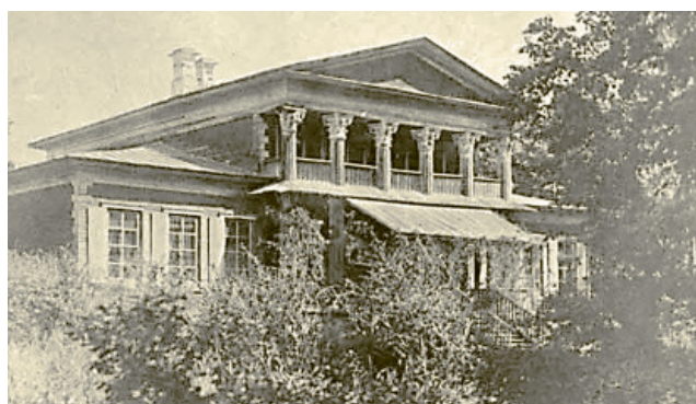
Главный дом усадьбы Урусовых в начале XX века

Типологически Казанская церковь близка малому собору Донского монастыря, построенному в 1593 году.