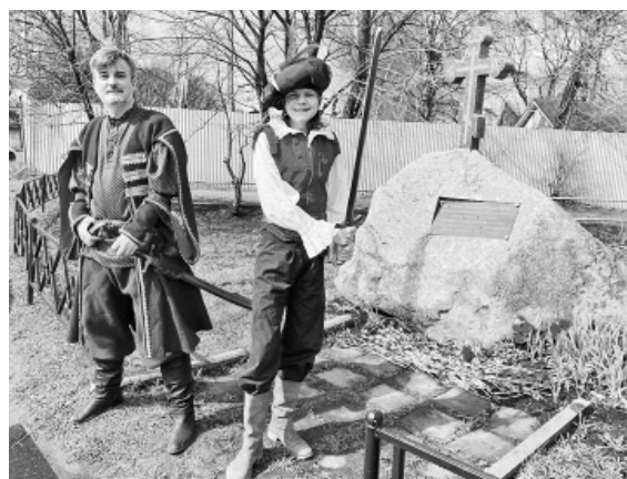
У памятного знака в с. Григорьевское