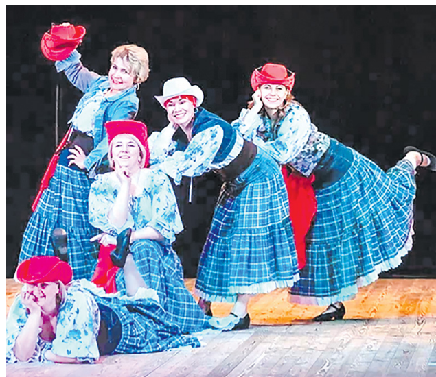
Танцевальный коллектив «Жасмин», с. Туношна