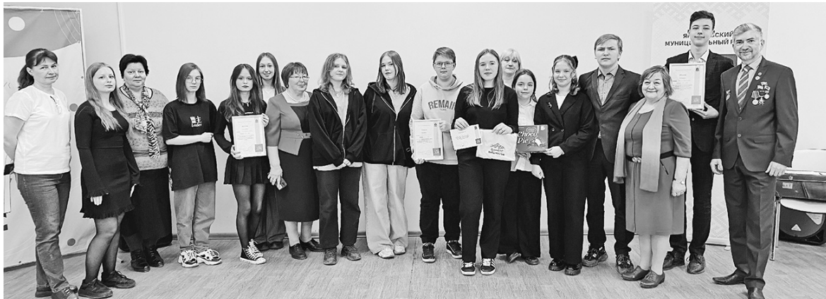
Участники и организаторы конкурса школьных музеев