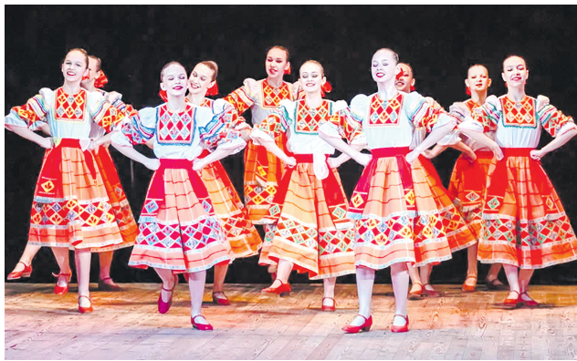
Ансамбль «Задоринка», п. Ивняки

бют, эстетика оставили прекрасное общее впечатление. Большое спасибо всем участникам конкурса!