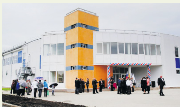
Физкультурно-оздоровительный комплекс «Созвездие» в п. Ивняки

В рамках центра успешно занимаются творчеством такие известные в Ярославском районе и за его пределами коллективы, как ансамбль эстрадной песни «Настроение», Образцовый хореографический ансамбль «Задоринка», народный самодеятельный ансамбль песни «Русская горница», творческое объединение «Танцы плюс», детские творческие студии «Сарафан», «Провинция», «Рассвет», вокальная студия «Секретов. Net», творческое объединение «Школа Шляпокляк», театральная студия «Ярар-